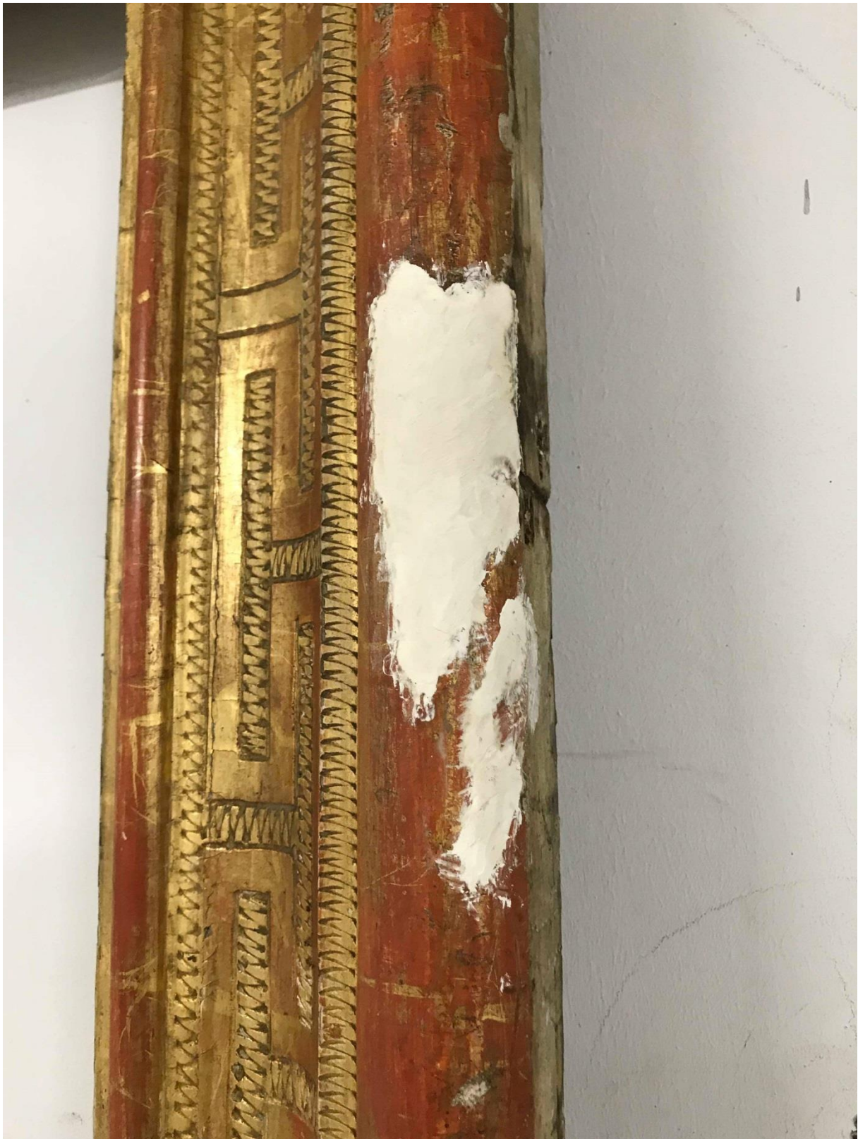
Bouchage des lacunes au gros blanc, sur la partie basse du cadre, côté droit.