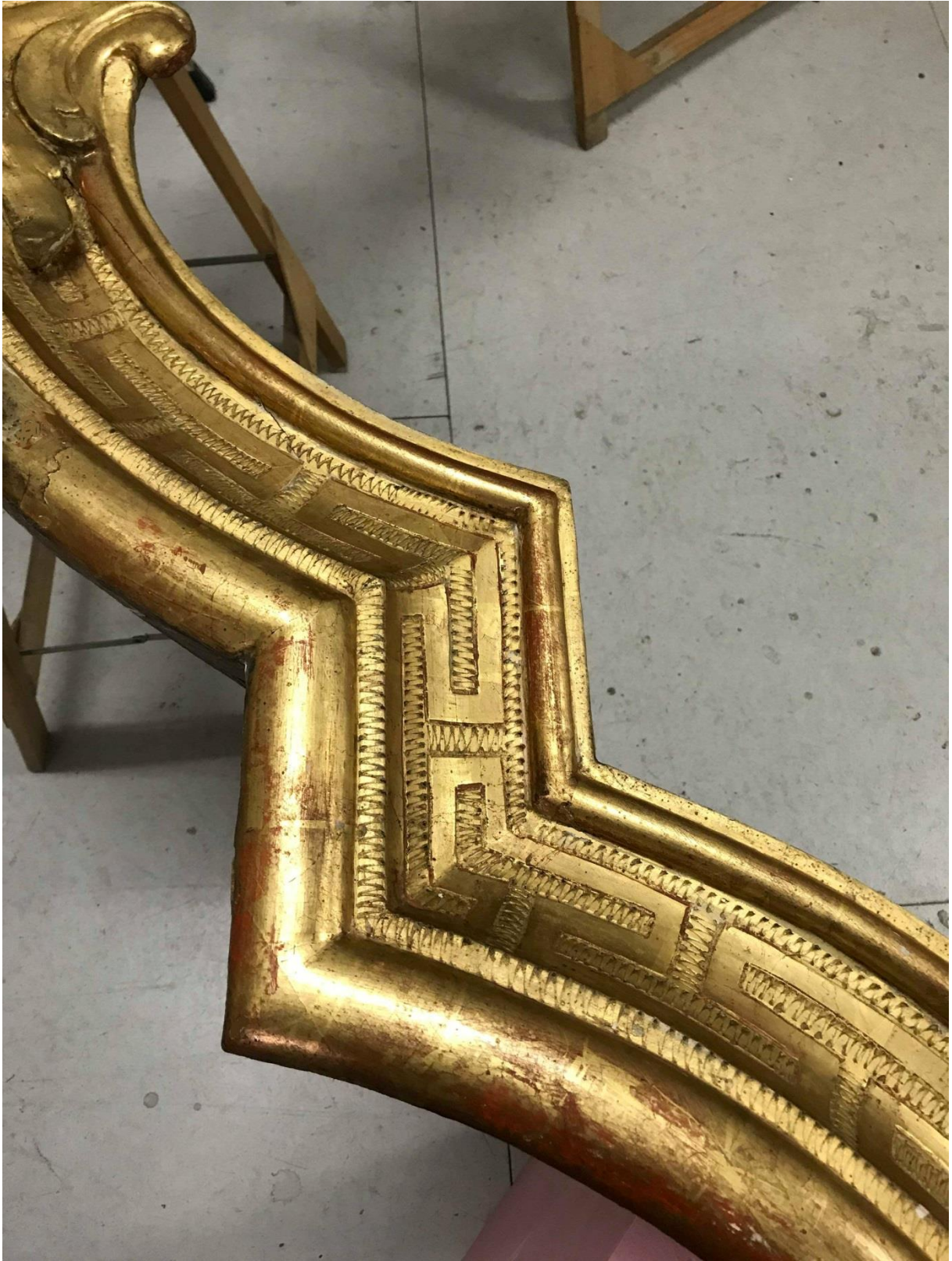
Détail du décrochement gauche de la partie haute du cadre après le travail de restauration.