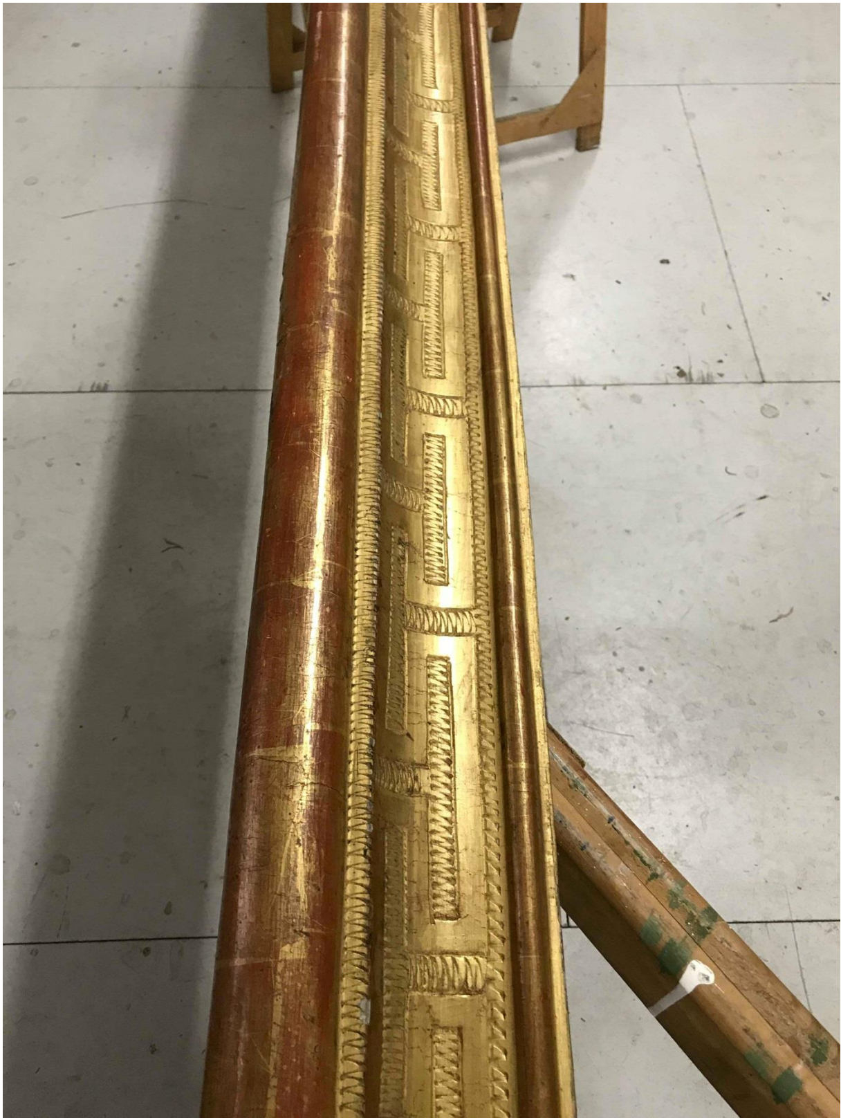
Côté gauche après décrassage et refixage des zones soulevées.