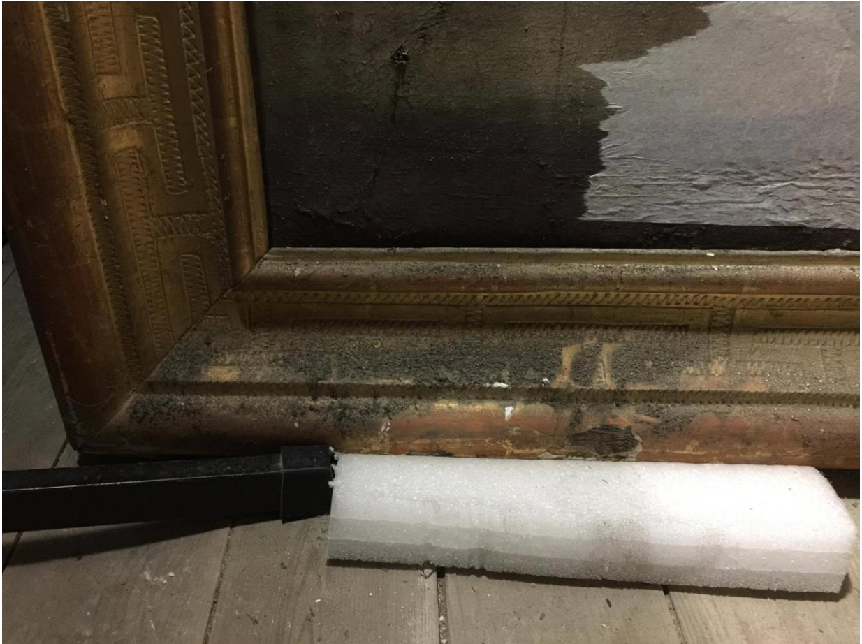
État avant interventions, traverse basse.