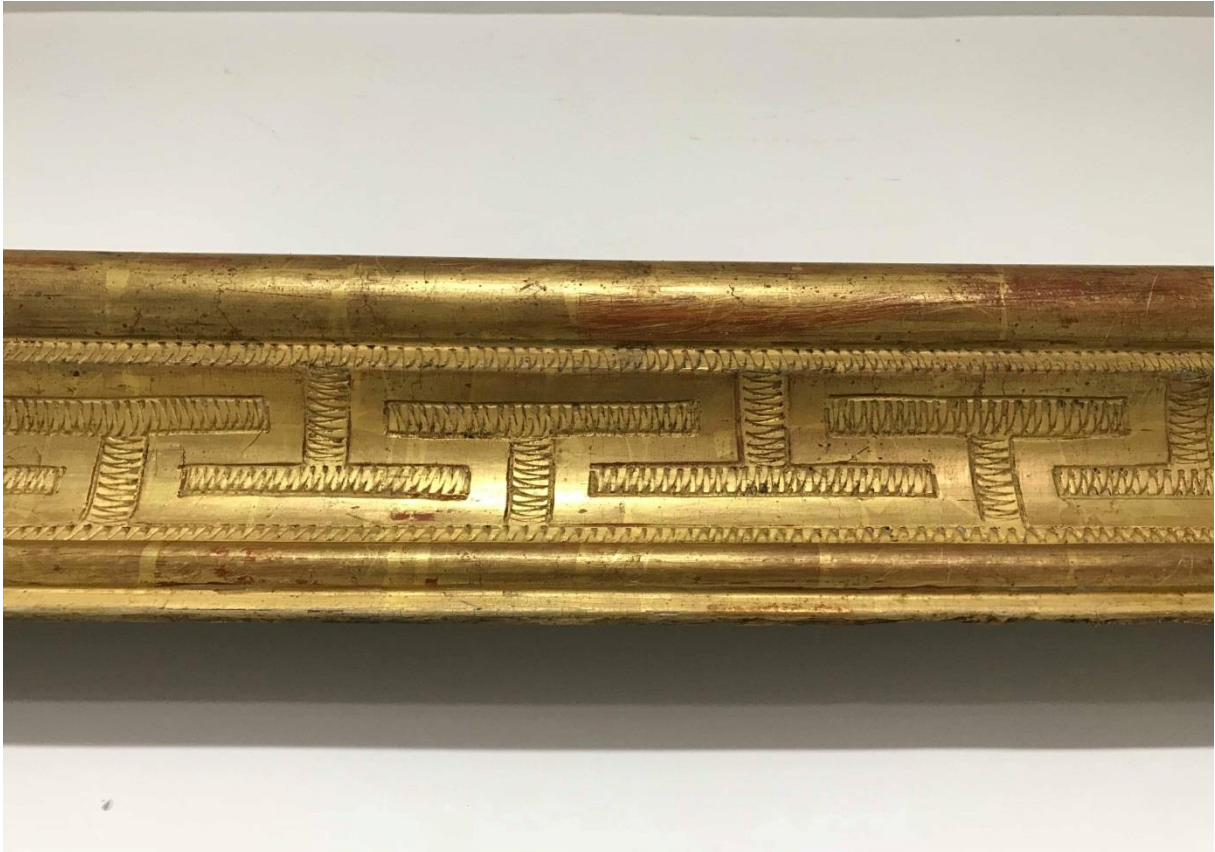
Milieu du côté droit du cadre après décrassage et refixage de la dorure.