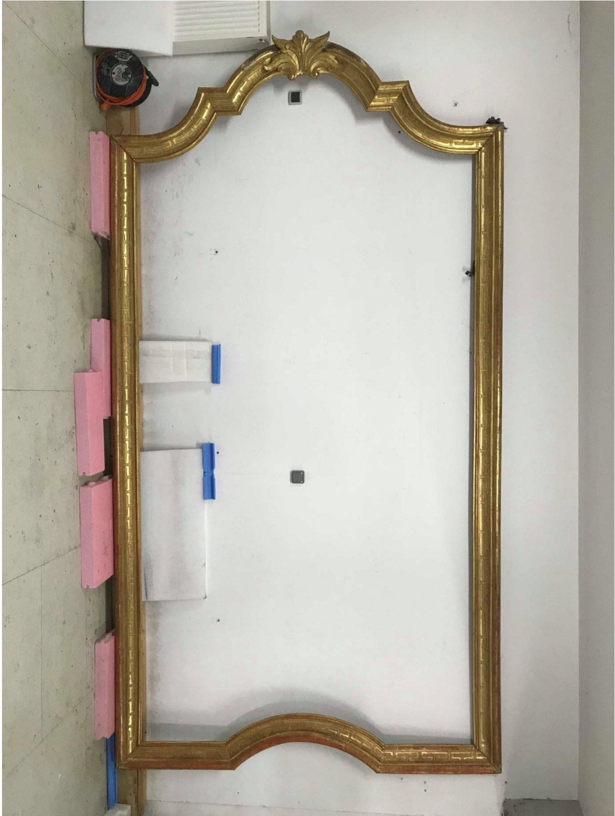
Aperçu de l'ensemble du cadre après le travail de restauration.