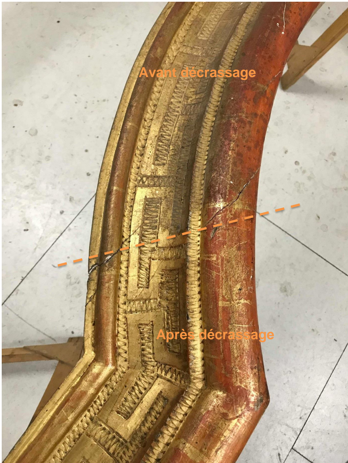
Décrassage de la dorure de la traverse basse.