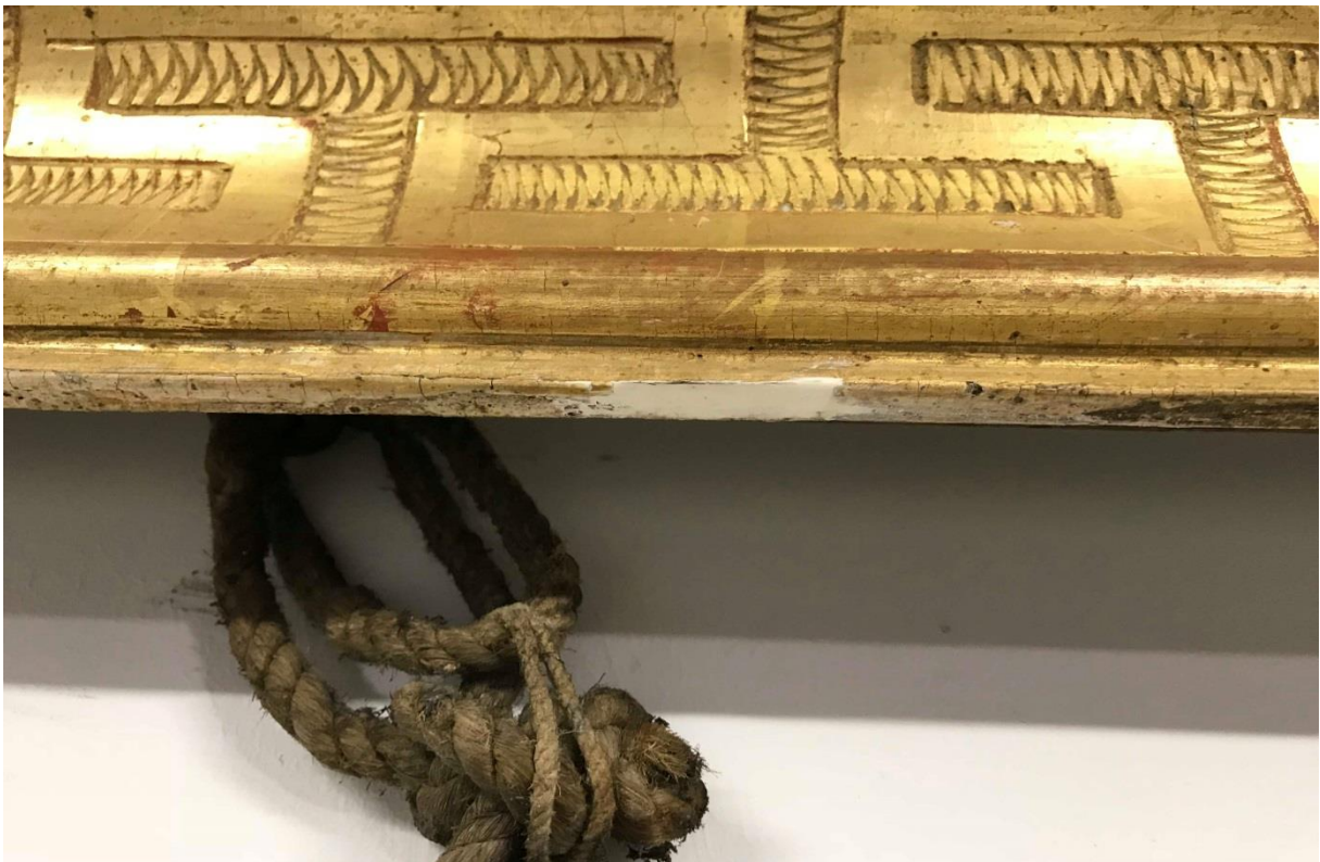
Bouchage de lacune du cadre, côté vue, milieu droit du cadre.