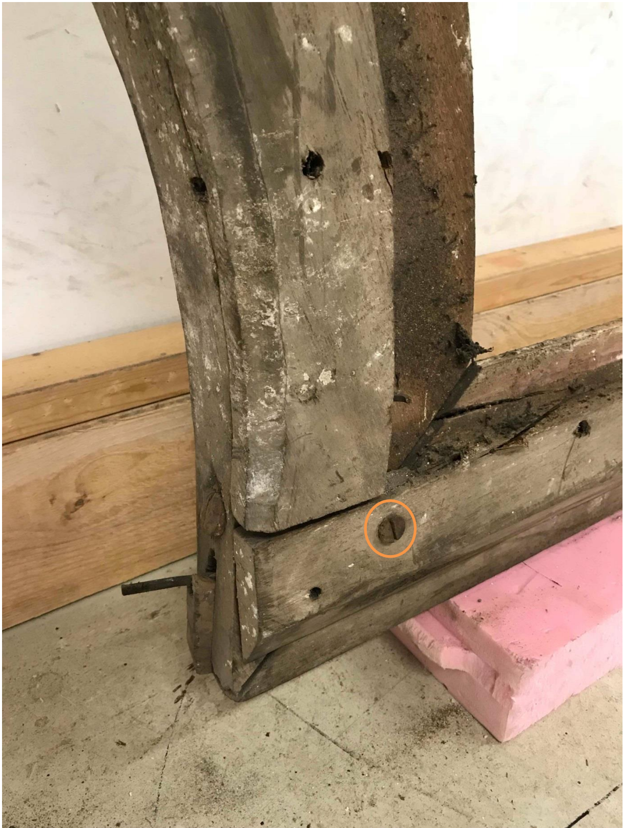
État avant interventions, coin haut droit avec vis de renfort moderne.