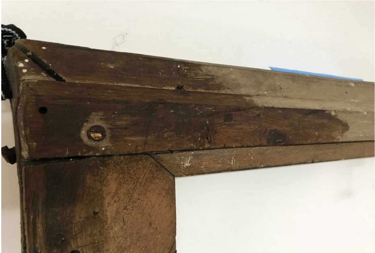
Nettoyage du revers en cours, coin haut droit.